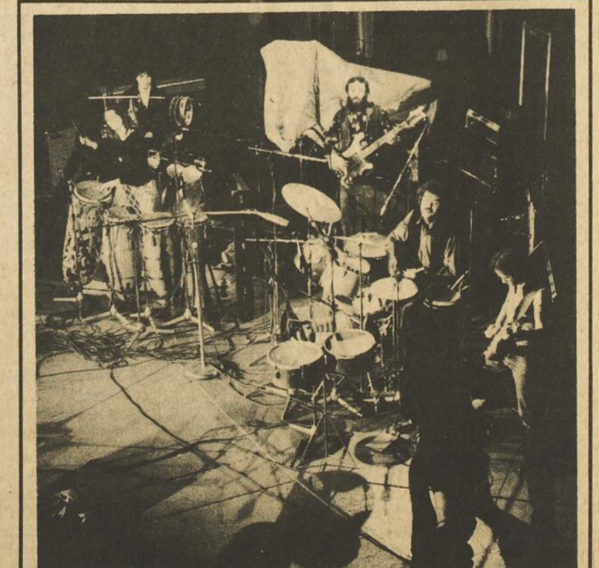
Ce soir à l'Outremont, "Toubabou"